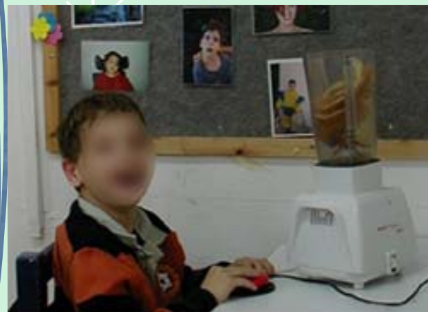
הפעלת מכשירים באמצעות מתג 🍌