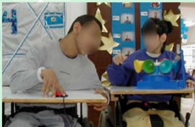
הפעלת צעצועי מתג 🍌